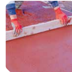
Hormigón preparado y prefabricado