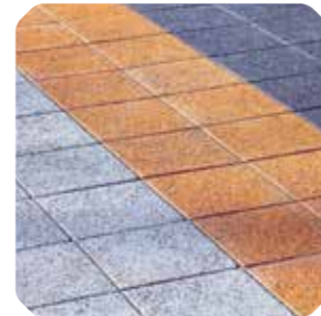
Adoquines de hormigón

Desde su uso en pavimentos, prefabricados de hormigón o tejas, descubra cómo nuestros pigmentos inorgánicos pueden llevar sus proyectos al siguiente nivel, aportando color, estilo y durabilidad.